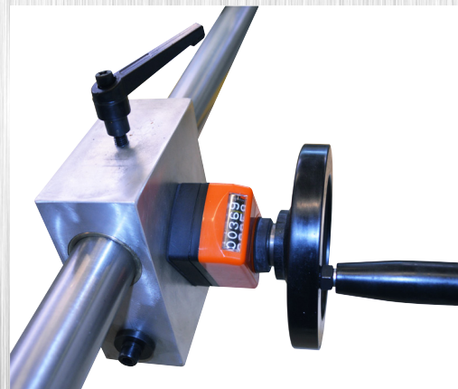
Spindeljusterbar bagstop med tæller