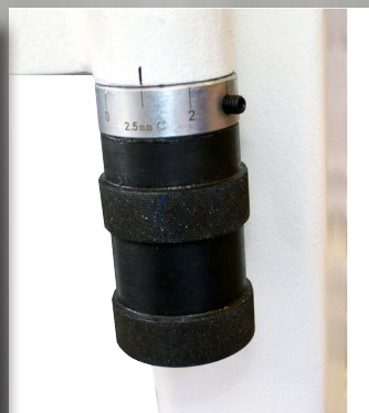
Nem tykkelses indstilling